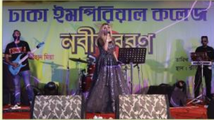
ব্যান্ড সংগীত পরিবেশন করছে 'বিদ্যুৎকন্যা'

তারিখ : ১২ ডিসেম্বর, ২০২০ রাওয়া কনভেনশন হল, ঢাকা