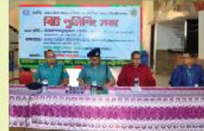
ইভটিজিং, মানক ও কিশোর অপরাধ প্রতিরোধে সামাজিক সচেতনতার, বিটি পুলিশিং সমাবেশ

ঢাকা ইম্পিরিয়াল কলেজে শিক্ষার্থীদের সামাজিক ও মূল্যবোধসম্পন্ন সুনামগরিক হিসেবে গড়ে তোলার জন্য লেখাপড়ার পাশাপাশি বিভিন্নমুখী সৃজনশীল কর্মকাণ্ডে অংশগ্রহণের সুযোগ দেয়া হয়। শিক্ষকদের তত্ত্বাবধানে আত্মহ ও পারদর্শিতা অনুযায়ী বিভিন্ন কলেজ-সোস্যাল, ভ্রমণ, শিক্ষাসফর এবং সমাজ সচেতনতামূলক কার্যক্রমে শিক্ষার্থীরা অংশগ্রহণ করে থাকে, যা তাদের সুষ্ঠু প্রতিভা ও মানসিক গুণাবলির বিকাশে বিশেষ ভূমিকা রাখে।