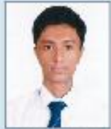
AFRAJ UJ JAMAN SIIANTO GST