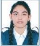
TROPA SARKER TITHI RU