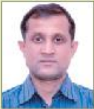
সার ডক্টার শিক্ষক প্রতিনিধি সহযোগী অধ্যাপক বাংলা বিভাগ