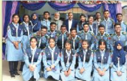
ঢাকা ইমপিরিয়াল কলেজ বার্ষিক ক্রীড়া প্রতিযোগিতার খতমি

ক্রীড়াবিদদের নিয়মিত শরীরচর্চার জন্য কলেজের মনোযোগ বচিত ট্র্যাকসুট, টি-শার্ট প্রদান করা হয়। বিভিন্ন ক্রীড়া প্রতিযোগিতায় তাদের অংশগ্রহণের সুযোগ দেয়া হয়। স্কাউটদের ইউনিফর্ম প্রদান করা হয়।