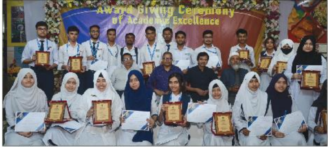
১ম বর্ষ বার্ষিক পরীক্ষার মেধা তালিকার স্থান গ্রাণ্ড শিক্ষার্থীদের সাথে অধ্যক্ষ, উপাধ্যক্ষ ও শিক্ষকবৃন্দ

ঢাকা ইম্পিরিয়াল কলেজের প্রচার ও প্রকাশনা শাখা থেকে প্রকাশিত। প্রকাশকাল : মে, ২০২৪ প্লেট : ২, ব্লক : বি, আফতাব নগর, বাঙা, ঢাকা-১২১২