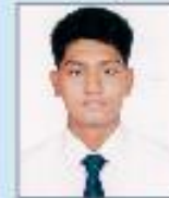
SHAH FATM TAJWAR DU