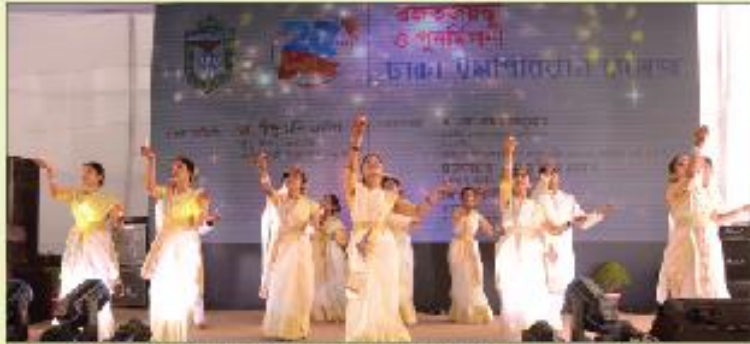
রজতজয়ন্তী ও পুনর্মিলনী অনুষ্ঠানে সাংস্কৃতিক পরিবেশনায় কলেজের নন্দন কাননের শিল্পীবৃন্দ