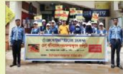
ডেঙ্গু প্রতিরোধে সচেতনতামূলক কার্যক্রমে শিক্ষার্থীরা আয়োজনে, ইম্পিরিয়াল সমাজসেবা কার্যক্রম ক্লাব