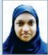
NUSAIBA NAWAL DU