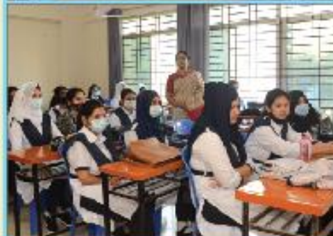
ছাত্রীদের জন্য পৃথক ক্রোর ও সেকশন