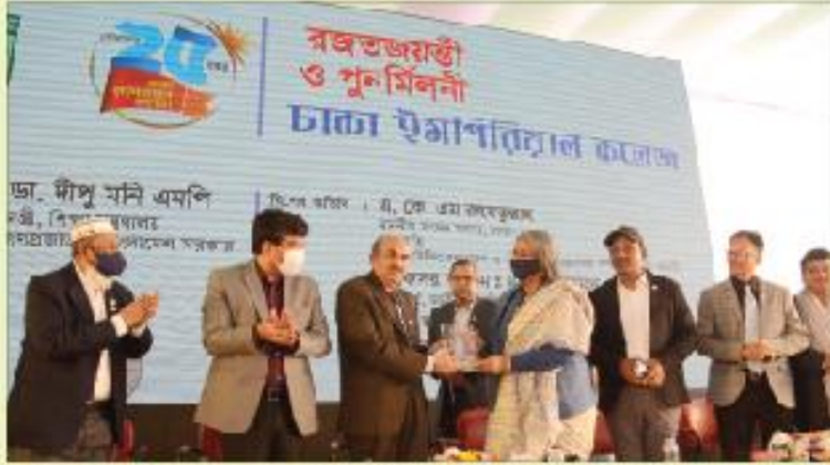
ঢাকা ইমপিরিয়াল কলেজের রজতজয়ন্তী ও পুনর্মিলনী অনুষ্ঠানের প্রধান অতিথি গণপ্রজাতন্ত্রী বাংলাদেশ সরকারের মাননীয় শিক্ষামন্ত্রী ডা. দীপু মনি এম.পি.-কে ভক্তেরা উপহার প্রদান করছেন গভর্নিং বডির সভাপতি ও কলেজ অধ্যক্ষ।